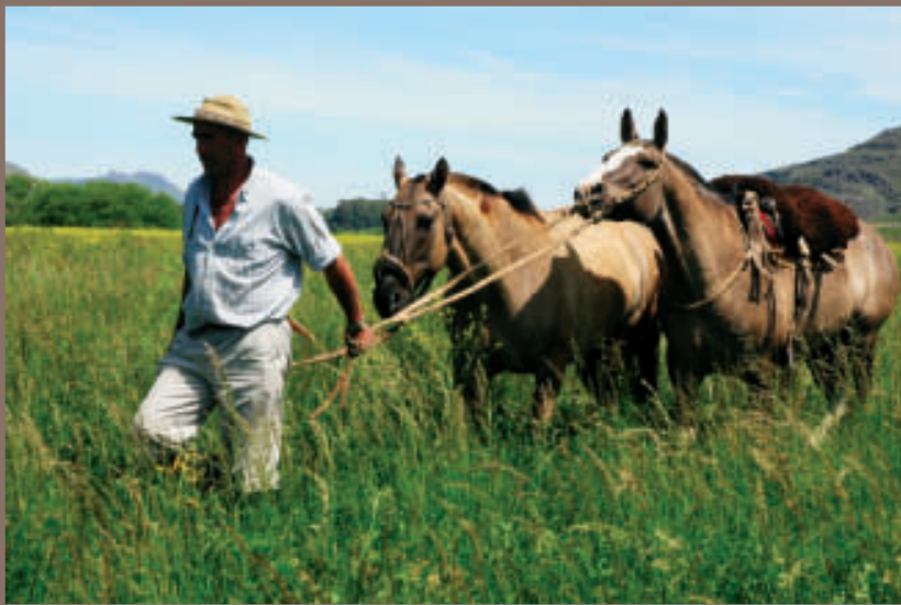
DE PAARDEN WORDEN GELEVERD EN VERZORGD DOOR EEN LOKALE GAUCHO. LET OOK OP HET UITSTEKENDE MES DIE DEZE MAN OP ZIJN RUG MEEDRAAGT. DE GAUCHOCULTUUR IS ECHT NOG EEN "WAY OF LIFE".

er kunstmatig geïncubateerd, omdat men zo nieuw bloed in het bestand kan brengen. Het is een kunst hoe efficiënt de mensen hier werken. In een uur tijd worden vlot heel wat koeien geïncubateerd. Na het insemineren en na het nuttigen van de nodige Maté gaan we mee om 500 koeien bijeen te drijven. In een enorme oppervlakte voelen we ons als echte cowboys. Met behulp van enkele honden wordt de klus vrij vlot geklaard. Maar dan begint het echte werk pas. Uit een groep van 500 koeien moeten alle bronstige koeien gehaald worden. De paarden tonen hier echt hun nut. Ze kennen als geen andere hun job en weten stevast de juiste koe er uit te drijven. Sommige taaie tantes worden zelf gesandwiched door twee paarden en zo uit de groep gehaald. Knap om zien