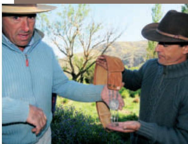
DE LAATSTE DAG TE PAARD VIEL SAMEN MET DE "DÍA NACIONAL DEL GAUCHO". VOOR DE LOKALE BEGELEIDERS IS DIT EEN BELANGRIJKE DAG EN WORDEN UNIEKE ERFSTUKKEN BOVEN GEHAALD.

Voor de liefhebbers kan er na deze trektocht nog een extra verblijf aangeboden worden in de schitterende stad Buenos Aires.