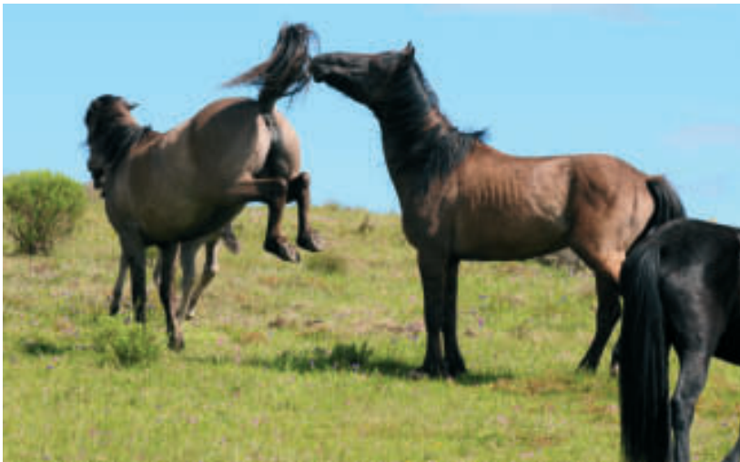
NAAST DE RITTEN TE PAARD BIEDT MISSION ARGENTINA OOK DE NODIGE ANDERE CULTURELE ACTIVITEITEN AAN. ZO BRACHTEN WE EEN BEZOEK AAN EEN PARK MET WILDE PAARDEN. HIERBIJ ENKELE FOTO'S VAN ONDERMEER TWEE HENGSTEN DIE VECHTEN VOOR EEN KUDDE EN EEN MERRIE DIE HAAR VEULEN BESCHERMT VOOR EEN HENGST.

lende landeigenaars en het is dan ook een eer dat wij deze unieke domeinen in mogen. Je merkt dit trouwens duidelijk aan de andere begeleiders. Zij wonen al jaren in deze streek en zijn verheugd dat ze mee deze private plaatsen mogen ontdekken. Want een ontdekkingsstocht dat is het echt wel!